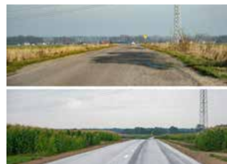
Dąbrowa Wielka – Kamień Rupie