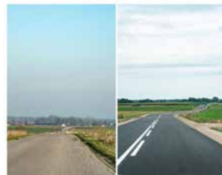
Dąbrowa Wielka – Kamień Rupie

Koniec roku to także początek następnego. Zawsze nam towarzyszy wtedy nadzieja na lepsze jutro. Jak nas wszystkich nauczyła pandemia, najważniejsze dla każdego jest zdrowie. Jest zdrowie – jest wszystko. I tego nieustającego zdrowia Państwu życzę. Do Siego Roku!